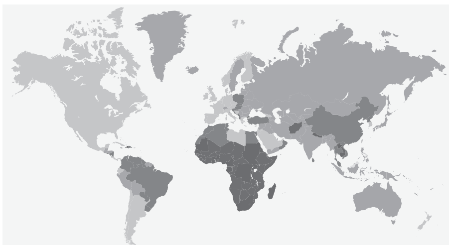
•• Figura 5.1 Il globo terrestre.