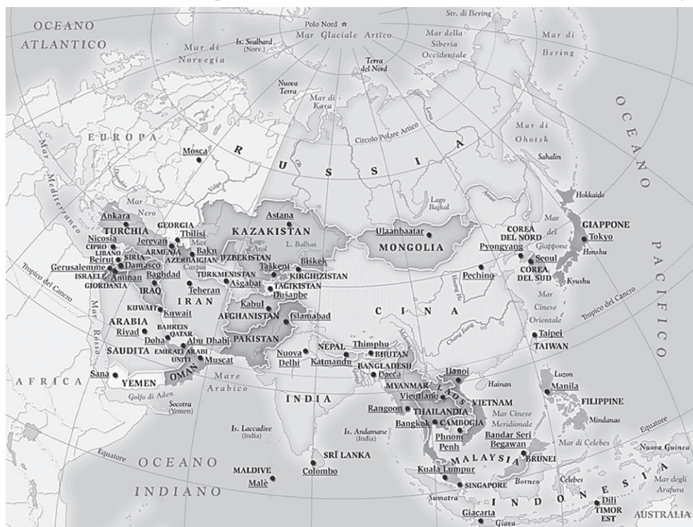
• Figura 5.2 L'Asia.

È il continente più esteso e più popolato del Globo, con una superficie pari a circa il 30% del totale delle terre emerse ed abitato da una popolazione che è pari al 60% della popolazione totale della Terra. È saldata all'Europa, con la quale forma un'unica massa continentale, l' Eurasia ; è unita all'Africa dall'Istmo di Suez, tagliato dal Canale omonimo, ed è separata dall'America settentrionale dallo Stretto di Bering.